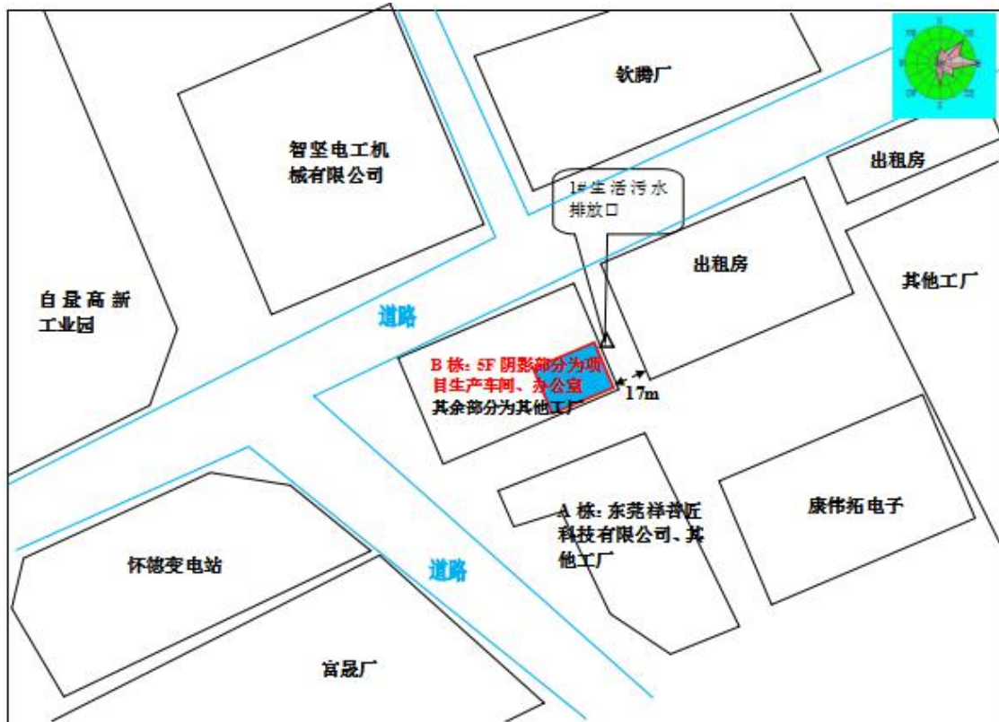
图3-1 厂区平面布置及监测点位